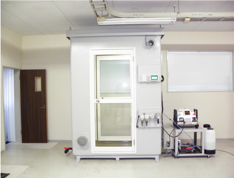
霧竜「K i R i」