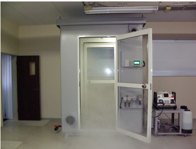
霧竜「K i R i」